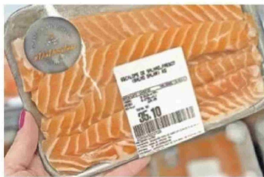
El salmón, principal producto exportado desde la Región de Magallanes al gigante sudamericano.

» Un 38% de las exportaciones de Magallanes en 2024 tuvieron como destino Brasil, lo que lo posicionó como el principal receptor de productos magallánicos, muy por sobre EE.UU. (19%) y China (16%)