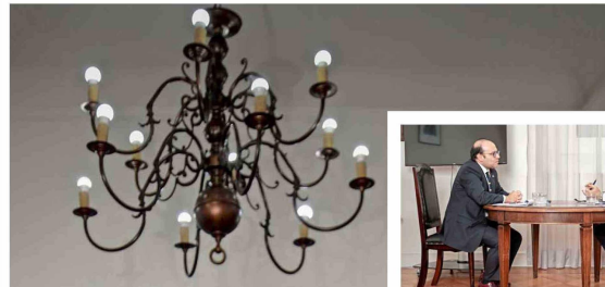
El Presidente Kast y el subsecretario, este jueves, en coordinaciones previas al fin de semana largo.

Pese a las contingencias, dice que no se han apartado del camino del gobierno de emergencia "ni un segundo" y desdramatiza las controversias de las primeras semanas. "No hay que confundir la muestra de carácter del Gobierno con errores", sostiene. Sobre las críticas del propio oficialismo, pone paños fríos: "Yo no he visto deslealtad", asegura.