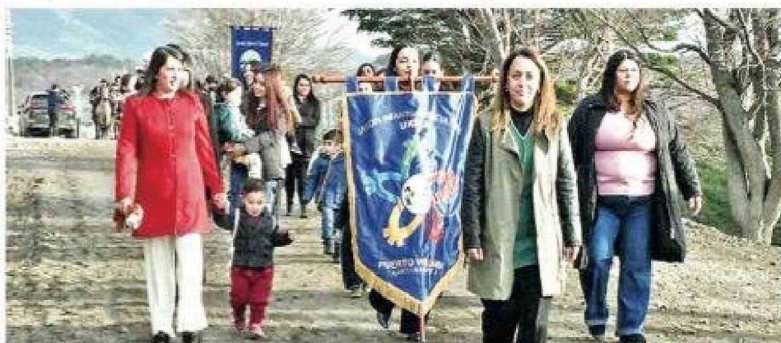
El jardín infantil intercultural Ukika.