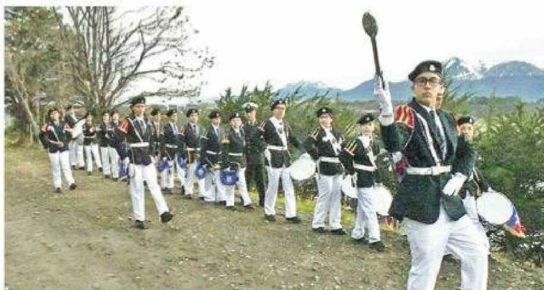
La banda de guerra del Liceo de Puerto Williams.