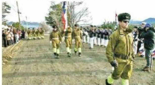
Carabineros de la Cuarta Comisaría.