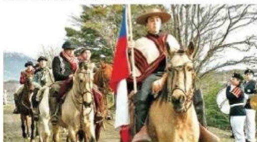
Estos jinetes saludaron a la Armada en su aniversario.