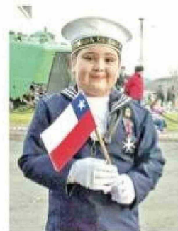
Esta niña se lució con su traje de marinera.