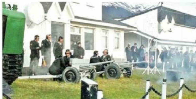
La salva de los 21 cañonazos constituye el máximo honor militar.