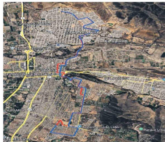
Servicio E04: Las Compañías - Centro de la Serena - Barrio Universitario - Hospital La Serena

Finalmente, se informó que también se evalúan proyectos de mayor envergadura, como la eventual implementación de un tranvía que complemente la red, en el marco de un sistema de transporte más moderno, integrado y sustentable.