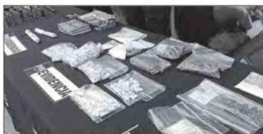
Cocaína, pasta base, marihuana y dinero en efectivo también fueron incautados durante los allanamientos.

dinación con el Ministerio Público. Lo que detectaron fue una red dispersa de puntos de venta de droga que operaban de manera independiente, pero con algo en común: todos mantenían armas para defender sus sectores. "No son dos bandas rivales, son distintos puntos independientes de venta de droga", explicó más tarde el prefecto inspector Guillermo Gálvez Carriel, je-