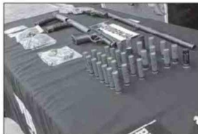
Explosivos, municiones y armamento incautado durante el megaoperativo de la PDI la madrugada de este miércoles.

Con esa información, equipos Microtráfico Cero (MT-0) de la PDI de Viña del Mar y Quillota comenzaron seguimientos y vigilancias en toda la zona, siempre en coor-