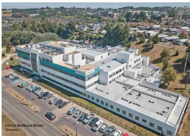
Clínica RedSalud Mayor Temuco.

Lo que más valoran los pacientes y sus familias es la posibilidad de resolver sus problemas de salud de forma integral sin salir de su región y a un precio accesible. Para ello, RedSalud cuenta