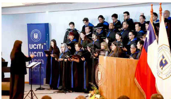
Al cierre de la ceremonia, el coro de la casa de estudios interpretó el himno institucional, sellando con sus melodiosas voces este importante hito académico.