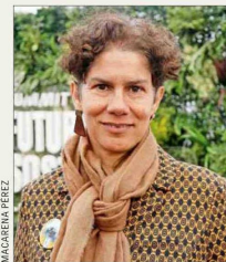
Maisa Rojas, exministra de Medio Ambiente.

La exministra volvió a la academia con el objetivo de aportar con datos científicos a la construcción de políticas públicas. “Yo soy profesora titular de la Facultad de Ingeniería en la Universidad de Chile, así es que he vuelto a la facultad. He estado de vacaciones ahora, (pero) retomo mi oficina y mi actividad académica, que significa continuar haciendo investigación, colaboraciones