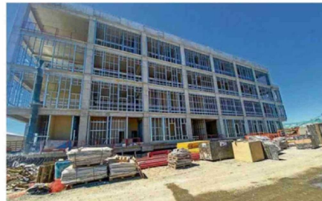
AVANCE DEL HOSPITAL DE RÍO BUENO.

La acción convocada por Quezada también fue rechazada por la Fenpruss La Unión. <3