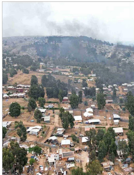
En la Región de Valparaíso se van a distribuir cerca de 1.000 subsidios, equivalentes a solo un cuarto de las viviendas de la megatoma de San Antonio, según Ignacio Aravena.

Se trata de las dos regiones más pobladas del país, después de la capital, pero también de zonas donde existe un desafío adicional en materia de vivienda, tras el daño físico que produjeron incendios forestales. En el caso de la Octava Región, habrá 1.472 subsidios disponibles, lo que según Aravena es una cantidad que puede resultar insuficiente en atención al contex-