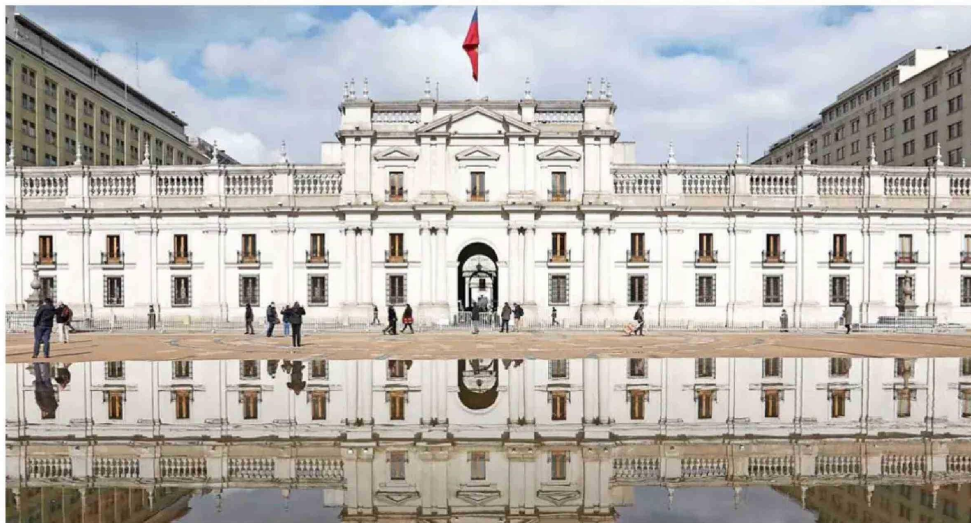
Presidencia de la República es el estamento con más casos en que funcionarios realizaron 40 horas extra diurnas o más, sumando todos sus empleados y todos los meses entre marzo de 2022 y marzo de 2025.

En segundo lugar figura una de las entidades con más funcionarios del Estado: Sa-