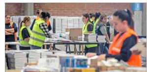
A nivel nacional, la Junaeb entregó 28 millones de artículos escolares este año.

Por su parte, el SLEP Santiago Centro comunicó que "rechazamos categóricamente todo acto que afecte la convivencia educativa, la seguridad de las comunidades escolares y el normal desarrollo de los procesos pedagógicos (...). Paralelamente, nos estamos articulando con la Seremi de Educación para buscar alternativas para dar continuidad a los procesos pedagógicos para garantizar el derecho a la educación".