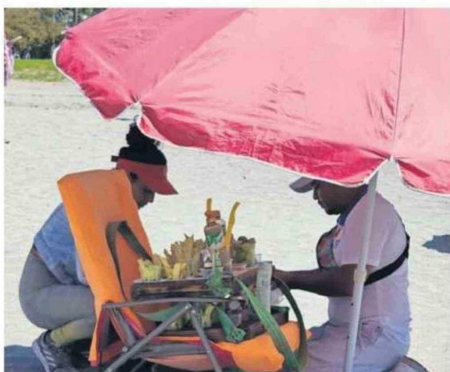
VENTA DE FRUTAS IRREGULAR EN LA PLAYA DE CAVANCHA.

Velásquez advirtió sobre la manipulación antihigiénica de los populares mojitos. “La fruta hemos visto que se cae al suelo, la vuelven a meter en los vasos, yo creo que mu-