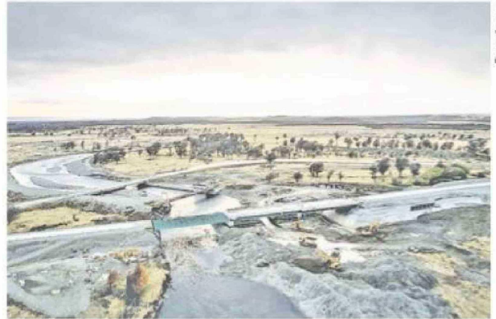
La construcción del puente sobre el río Rubens, en la provincia Última Esperanza.

"No consideramos que sea un valor exageradamente alto, son los estándares y los valores, y al final lo que funciona es la oferta y el mercado", cerró Marusic.