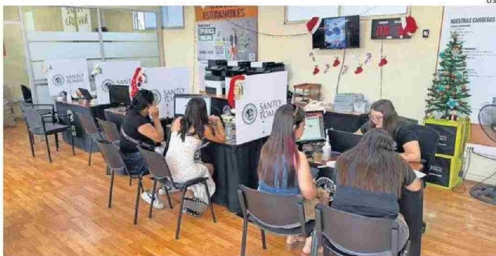
EN EL LUGAR HAY PERSONAL CAPACITADO PARA RESOLVER DUDAS, INFORMAR Y ORIENTAR.

cuenta con personal capacitado para resolver dudas, orientar en la elección vocacional, revisar requisitos de ingreso, informar sobre beneficios y alternativas de financiamiento, además de acompañar paso a paso el proceso de postulación.