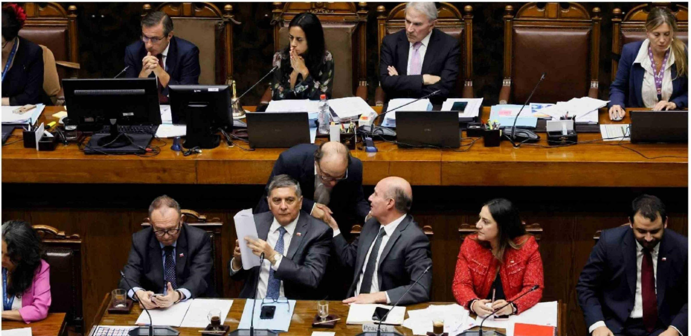
► El riesgo de la estrategia del gobierno está en que una aprobación estrecha de la idea de legislar podría derivar en un escenario político complejo.