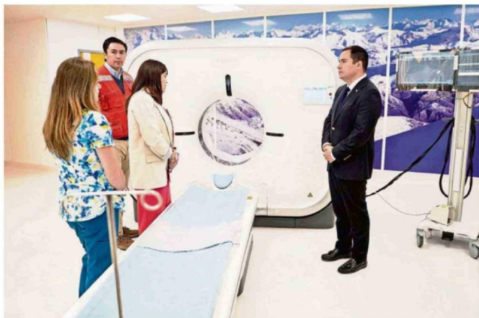
AUTORIDADES REGIONALES RECORREN LAS INSTALACIONES DEL NUEVO HOSPITAL REGIONAL DE ÑUBLE, DESTACANDO SU AVANCE.