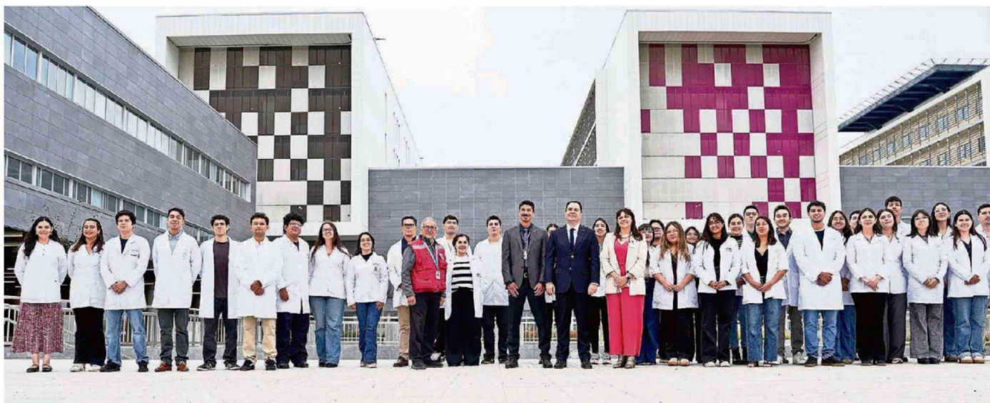
NUEVOS MÉDICOS Y ODONTÓLOGOS CONOCEN EL HOSPITAL EN EL MARCO DE SU INCORPORACIÓN A LA RED DE ATENCIÓN PRIMARIA.