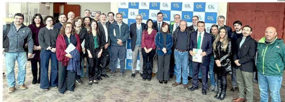
EN EL LANZAMIENTO PARTICIPARON DISTINTOS REPRESENTANTES DE LA CADENA LÁCTEA DE LA ZONA SUR.