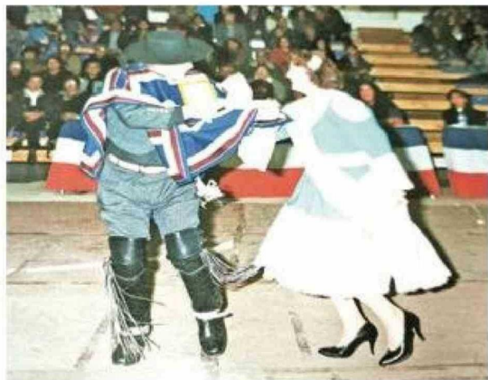
Cuando fue campeón regional de cueca en la categoría Adultos Mayores, en 2006.

Entre algunos de sus títulos, menciona "Punta Arenas frente al mar", "Me caso