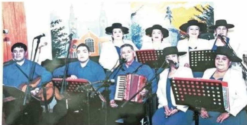
Con su inseparable acordeón, integrando uno de los tantos conjunto de corte folclórico.