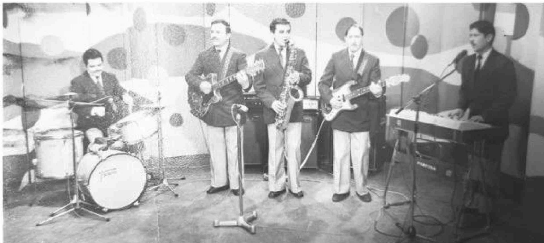
Integrando el conjunto musical "Los Zenit".

Tiraje: 3.000 Lectoría: 9.000 Favorabilidad: No Definida