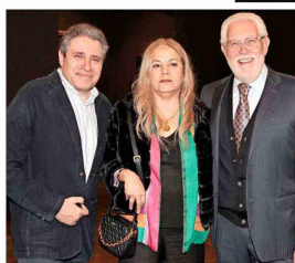
Francisco Kreutzberger, Jessica Sotello y Patricio Kreutzberger.