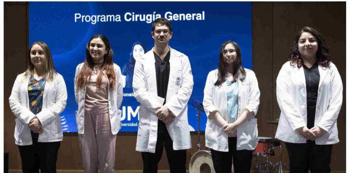
PARTE DE LOS PROFESIONALES QUE INICIARON SU FORMACIÓN DE ESPECIALIDAD EN MAGALLANES.

6 cupos entre las tres especialidades se abrieron en la Universidad de Magallanes.