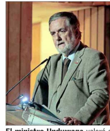
El ministro Undurraga valoró el aporte de la publicación.