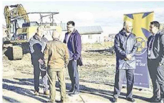
Las faenas para el centro de Puerto Williams comenzaron oficialmente el 13 de enero de este año con los primeros movimientos de tierra y se estima que la construcción finalice el 14 de diciembre de 2026.

La presencia anticipada del Centro de Rehabilitación en Puerto Williams sorprendió a gran parte de la comunidad, ya que el proyecto del edificio definitivo continúa en cons-