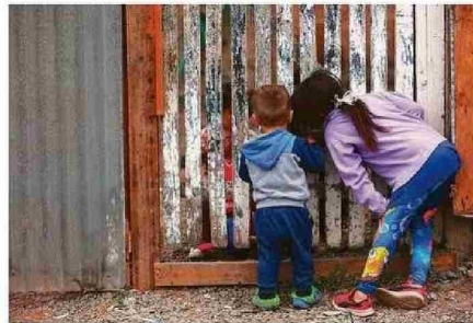
MÁS DE 19 MIL NIÑOS DE LA ZONA VIVEN ESTAS CONDICIONES.