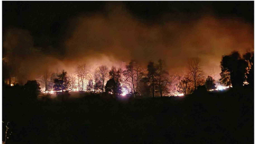
EL INCENDIO EN RUCÚE ha consumido cerca de 486 hectáreas y mantiene bajo vigilancia sectores habitados de Antuco.

zona siguieron atentos el avance del incendio y la presencia de humo visible desde distintos puntos de la comuna, mientras los equipos técnicos monitoreaban posibles cambios en la dirección del fuego.