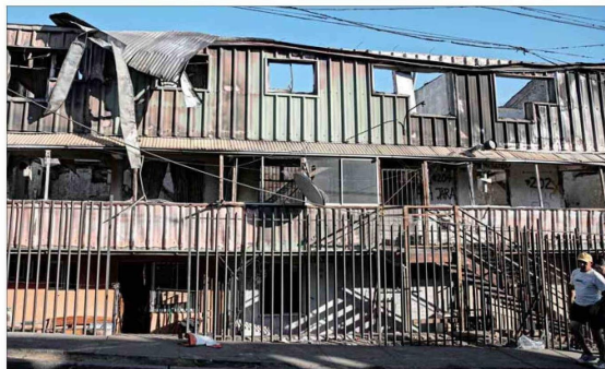
Las tres propuestas de la autoridad para los vecinos de Ríos de Chile consisten en entregar un subsidio de arriendo, un bono de acogida o ser parte de una villa de emergencia.