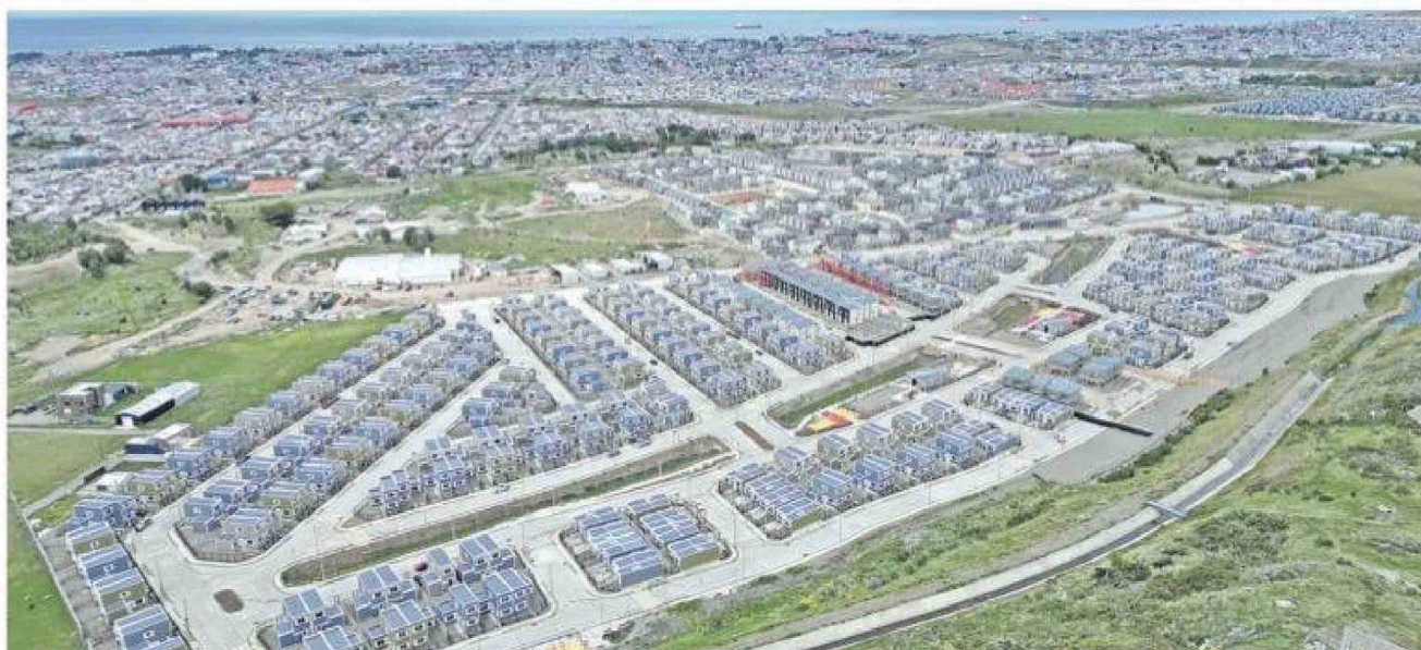
El complejo habitacional villa Los Sauces, cuya única vía de acceso por ahora es la prolongación General del Canto.