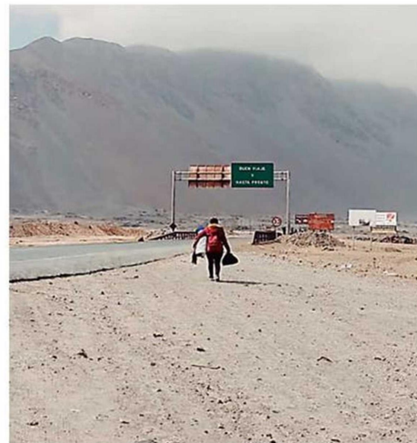
A PIE, LAS PERSONAS CONTINÚAN CAMINO HACIA EL SUR.