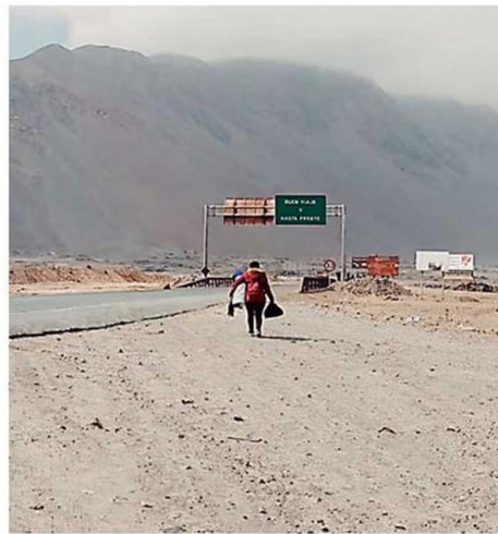
A PIE, LAS PERSONAS CONTINÚAN CAMINO HACIA EL SUR.