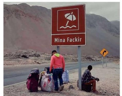
CIENTOS DE PERSONAS INGRESAN DIARIAMENTE A CHILE.

Un funcionario cuenta que todos los días llegan autos a las cercanías a dejar gente o incluso bor-