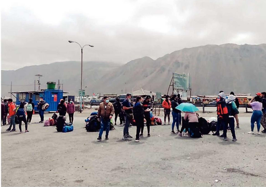
DECENAS DE PERSONAS TOMAN EL LOA COMO UN DESCANSO, A LA ESPERA DE QUE ALGÚN VEHÍCULO LES PERMITA AVANZAR A SANTIAGO.

Aunque el complejo aduanero tiene ciertos servicios, como un quiosco donde el agua de litro y medio cuesta $1.600 (como un 50% más que en un