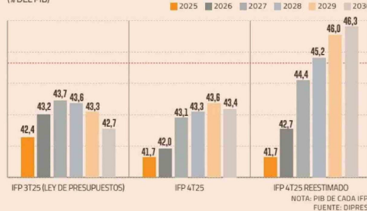
DEUDA BRUTA Y LA TRAYECTORIA REESTIMADA (% DEL PIB)

distintas variables del modelo y detectó la brecha. “Esa detección es la razón principal por la que la publicación del informe se postergó: publicar cifras inconsistentes habría sido un error mayor”, agregaron.