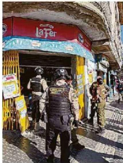
OPERATIVOS EN LA REGIÓN.