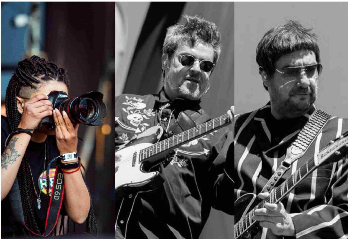
► "Con Los Tres comencé en 2018, antes del estallido social, en el Teatro Biobío", cuenta la fotógrafa Mariana Soledad.

Tiraje: 78.224 Lectoría: 253.149 Favorabilidad: No Definida