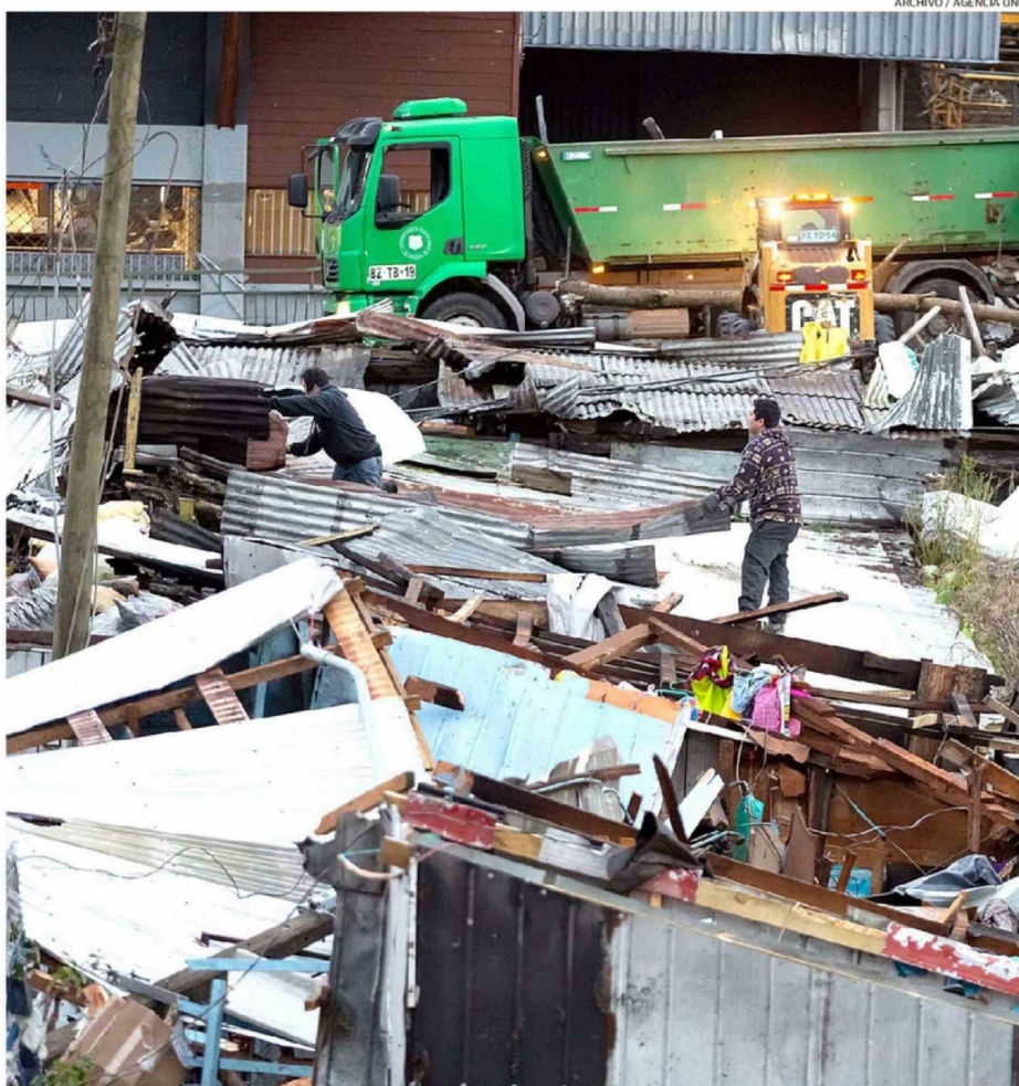
A UN AÑO DEL TORNADO, EL MUNICIPIO DESTACÓ AVANCES EN RECONSTRUCCIÓN, FORTALECIMIENTO INSTITUCIONAL Y RECUPERACIÓN COMUNITARIA.

maron que se ha invertido más de 13 mil millones de pesos en la reconstrucción, provenientes de fondos públicos y privados, destinados principalmente a la recuperación de viviendas, restauración de espacios públicos, apoyo a emprendimientos que sufrieron daños, fortalecimiento de equipos de emergencia y recuperación patrimonial. "Hoy, a un año de esa fecha, hemos logrado ejecutar un 75% del plan, demos-