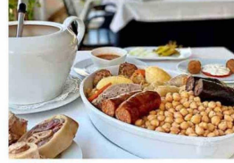
CRUZ BLANCA DE VALLECAS