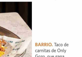
BARRIO. Taco de carnisas de Only Gozo, que gana protagonismo en Vallecas.

nia y siempre de proveedores de confianza”, concluye la madreleña.