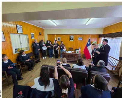
La Cruz Roja, filial Puerto Natales, celebró su 110° aniversario, consolidándose como un pilar fundamental de la salud y la solidaridad en la región.