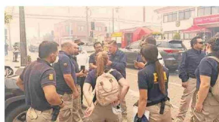
La Fiscalía instruyó a la PDI diligencias en sitios del suceso y a Carabineros el resguardo de estos como parte de la investigación.

de Penco, otros en terreno, a personal de la unidad de víctimas y testigos desplegada con nosotros acá y además en el Servicio Médico Legal (SML)". La persecutora indicó que se está trabajando en tres líneas: la primera es la instrucción de un equipo policial específico de la PDI en los sitios del suceso; también acompañar a los Laboratorios de Carabineros y de la PDI en el levantamiento de los 18 cadáveres (17 de la población Ríos de Chile en Lirquén y uno en Punta de Parra) y la eventual identificación inmediata o toma de datos para avanzar en ese proceso; así como el apoyo a las víctimas "que son muchas hoy y también en ese sentido tenemos un equipo multidisciplinario apoyando acá en Penco y al SML".