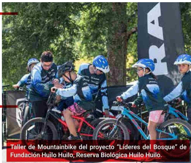
Taller de Mountainbike del proyecto “Líderes del Bosque” de Fundación Huilo Huilo, Reserva Biológica Huilo Huilo.

“CASI UN 70% DE LAS COMUNIDADES HA MEJORADO SU CALIDAD DE VIDA DESDE LA LLEGADA DEL TURISMO”.