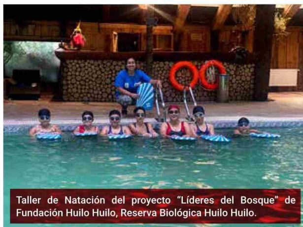
Taller de Natación del proyecto “Líderes del Bosque” de Fundación Huilo Huilo, Reserva Biológica Huilo Huilo.

apoyado la creación de emprendimientos de turismo, talleres de artesanía, educación ambiental, operativos de salud, talleres deportivos y culturales. El impacto ha sido significativo, ya que según un estudio de la Universidad de Duke, casi un 70% de las comunidades ha mejorado su calidad de vida desde la llegada del turismo. Además, cerca del 80% de las colectividades hoy trabaja en el rubro turístico y son los principales promotores y embajadores del cuidado del bosque y de los proyectos de conservación de la fundación.