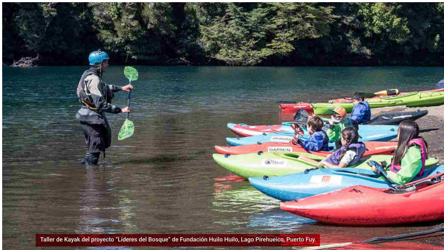
Taller de Kayak del proyecto "Líderes del Bosque" de Fundación Huilo Huilo, Lago Pirehueico, Puerto Fuy.

La Fundación Huilo Huilo viene destacando desde hace décadas por su trabajo y compromiso con la conservación del medio ambiente y la vida silvestre en la región de Los Ríos, en medio de Los Andes Patagónicos. Entre sus proyectos más destacados se encuentra la exitosa recuperación del huemul del sur, una especie en peligro de extinción. Iniciado en 2005, este proyecto pionero ha logrado reintroducir dos familias de huemules en su hábitat natural, marcando un hito de conservación después de 30 años de extinción en la zona.