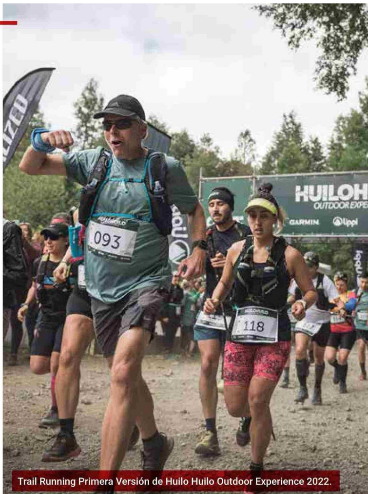
Trail Running Primera Versión de Huilo Huilo Outdoor Experience 2022.

vacación de esta emblemática especie en peligro de extinción. Iniciado en 2005, este proyecto es el primero de su tipo a nivel mundial y se ha convertido en un modelo de éxito para la reintroducción de huemules en su hábitat natural.