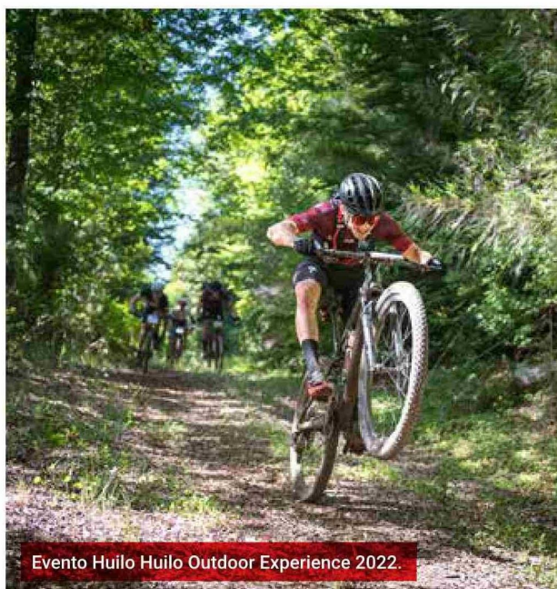
Evento Huilo Huilo Outdoor Experience 2022.

“LA FUNDACIÓN HUILO HUILO TIENE COMO MISIÓN CONSERVAR EL BOSQUE HÚMEDO TEMPLADO, JUNTO CON LAS COMUNIDADES, PARA MEJORAR LA CALIDAD DE VIDA PRESENTE Y FUTURA”.