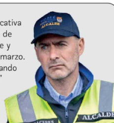
Ítalo Cáceres, alcalde de Tomé

"Esto permitirá a la comunidad educativa —a los más de 200 niños de Punta de Parra— tener un espacio confortable y adecuado para iniciar sus clases en marzo. Estamos contentos de seguir avanzando en la reconstrucción de la localidad"