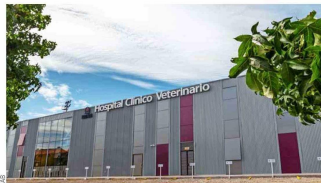
UNAB inauguró recientemente dos nuevas clínicas en Talcahuano y Santiago Centro, que se suman a los recintos de Colina y Viña del Mar.