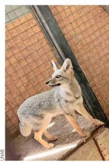
Hembra adulta de zorro chilla, recuperada de sus lesiones en la Unidad de Rehabilitación de Fauna Silvestre.

Rehabilitación de Fauna Silvestre (UFAS).