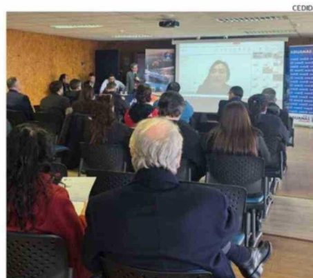
LA ACTIVIDAD REUNIÓ A FUNCIONARIOS DE LA DIRECCIÓN DE ADUANAS.