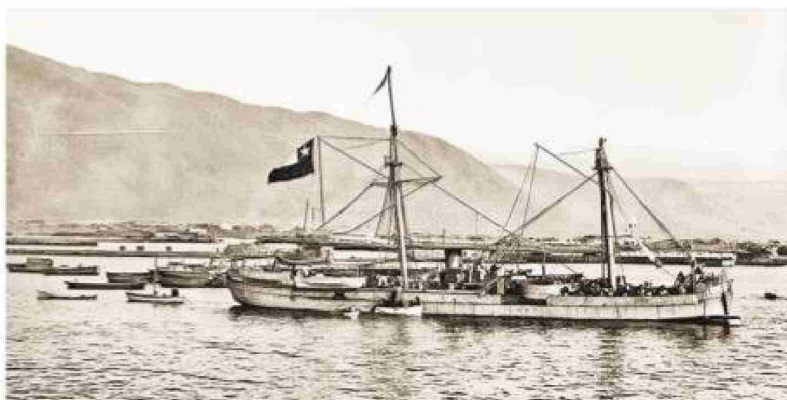
El Huáscar en la bahía de Iquique, durante la guerra civil de 1891.