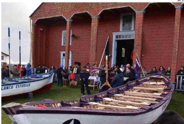
LA PROYECTADA RESTAURACIÓN DEL TEMPLO JESÚS NAZARENO DE CAGUACH SE ENCUENTRA EN ETAPA DE DISEÑO.

destacan por su amplia oferta, que incluye 1.420 alojamientos, 31.509 camas disponibles, 796 restaurantes, además de 333 operadores y agencias de turismo.