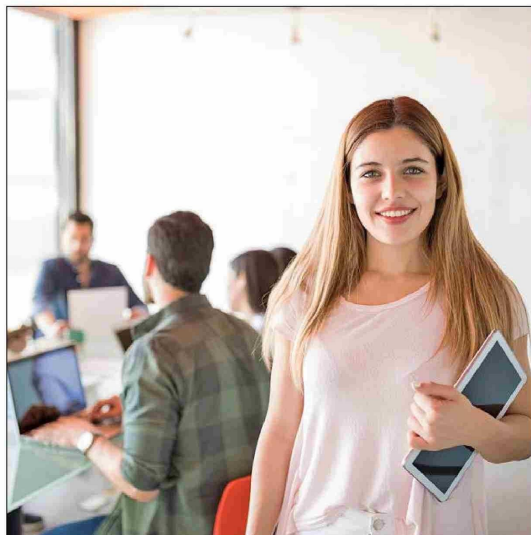
Las personas nacidas entre finales de la década de 1990 y principios de la de 2010, tienen un concepto del éxito laboral diferente al de otras generaciones.

L a generación Z, la de las personas nacidas entre finales de la década de 1990 y principios de la de 2010, periodo que algunos especialistas sitúan específicamente entre los años 1997 y 2012, aunque resulta difícil marcar límites generacionales y generalizar sus respectivas filosofías de vida, presenta rasgos que la diferencian de otras generaciones en distintos aspectos.