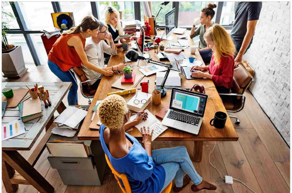
Para la Generación Z, un puesto de trabajo tradicional sirve para "pagar las facturas" y financiar lo que les apasiona y define su identidad y realización personal.

Aunque se calcula que en 2025 uno de cada diez