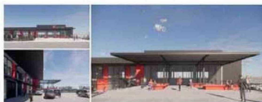
Foto referencial nuevo edificio INACAP sede Calama.