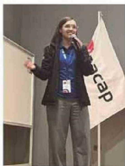
Expositores Semana Chile Emprende, sede INACAP Calama.