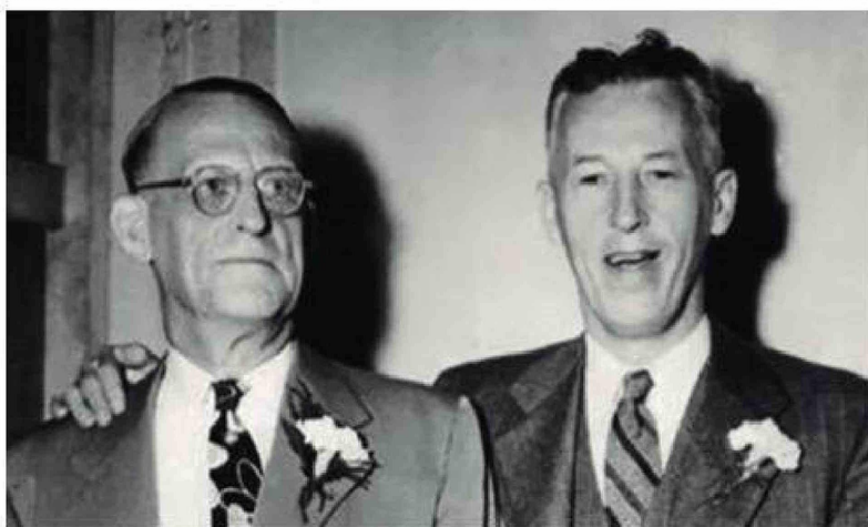
Cuando se cumplen 91 años de aquel primer encuentro entre William Wilson y el doctor Robert Smith, Alcohólicos Anónimos suma más de 123.000 grupos distribuidos en 180 países.

E n Días sin huella , la película dirigida por Billy Wilder y estrenada en 1945, Ray Milland da una clase magistral de actuación en el papel de Don Birman, un escritor que ha conocido el éxito cuya adicción a la bebida lo ha derrumbado física, moral y económicamente hasta convertirlo en una piltrafa que no tiene otra voluntad que conseguir alcohol para el próximo trago sin reparar en los medios. La película se basa en la novela del mismo nombre escrita por Charles R. Jackson, pero los motivos de Wilder para filmarla no surgieron de la lectura de esa obra sino de una cuestión muy personal: estaba perturbado después de haber trabajado con Raymond Chandler en el guion de su película anterior, Double Indemnity , y en las consecuencias que eso tuvo para el escritor considerado el mayor maestro de la novela negra estadounidense. En ese momento Chandler era un alcohólico en recuperación, pero el estrés y la difícil relación que entretejió con