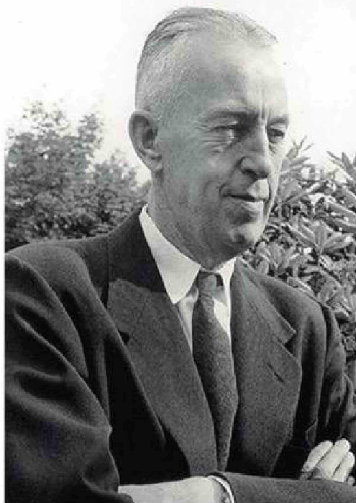
William Griffith Wilson, también conocido como Bill Wilson o Bill W., fue el fundador de la asociación Alcohólicos Anónimos junto con el Dr. Robert Smith.

Después de seis meses de tratamiento en el hospital, Wilson fue dado de alta y salió como si se hubiese curado. Fue un espejismo: el primer fracaso con que se enfrentó estuvo a punto de hacerlo recaer. Le ocurrió en un viaje a Akron, Ohio, donde haría una