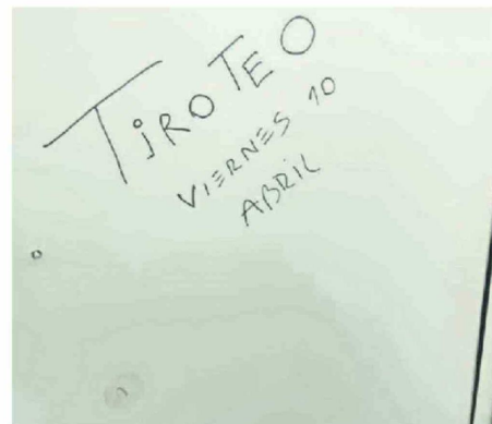
RAYADOS SE VIRALIZARON EN LAS REDES SOCIALES.

Por el momento el individuo continúa como prófugo, de acuerdo con el municipio.