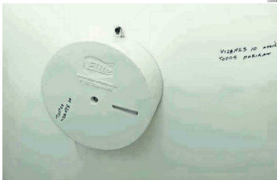
RAYADOS FUERON ENCONTRADOS EN BAÑOS DE LA UNIVERSIDAD ANDRÉS BELLO SEDE CONCEPCIÓN.

Desde el Centro de Estudiantes UNAB se indicó en un comunicado que “consideramos inaceptable que, frente a una situación de esta magnitud, no exista una comunicación transparente, oportuna y responsable por parte de las autoridades correspondientes. La seguridad y el bienestar de