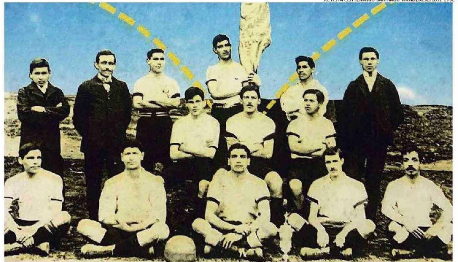
REVISTA CENTENARIO SANTIAGO WANDERERS 1892-1992