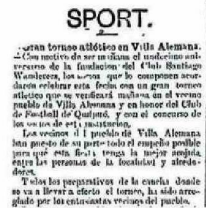
MERCURIO, 19 DE DIC. DE 1903.