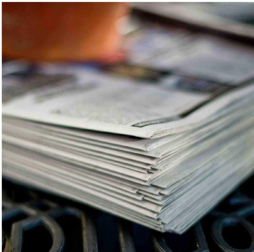
► Las bajas en su cartera golpean a la ministra en momentos en que el gobierno impulsa medidas de austeridad fiscal.

que había sido convocado justamente para abordar esas áreas. Sin embargo, afirman que el foco de Lincolao empezó a desplazarse hacia el desarrollo de empresas tecnológicas y tecnologías emergentes, relegando a segundo plano las prioridades científicas tradicionales de la cartera.