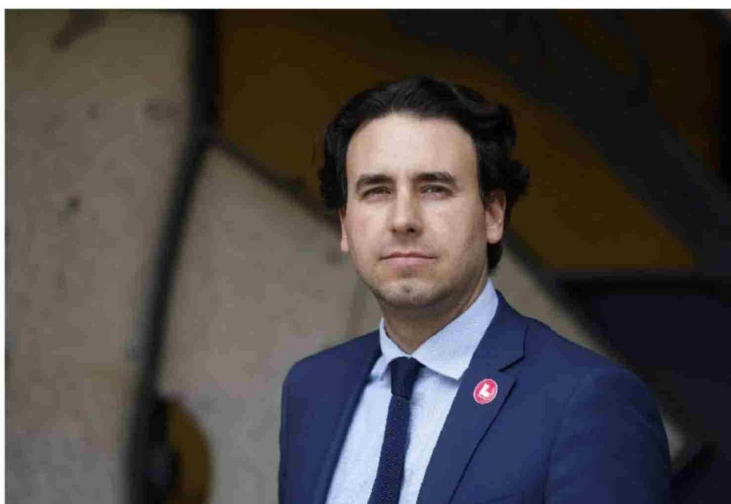
► El diputado Vlado Mirosevic, militante del Partido Liberal.