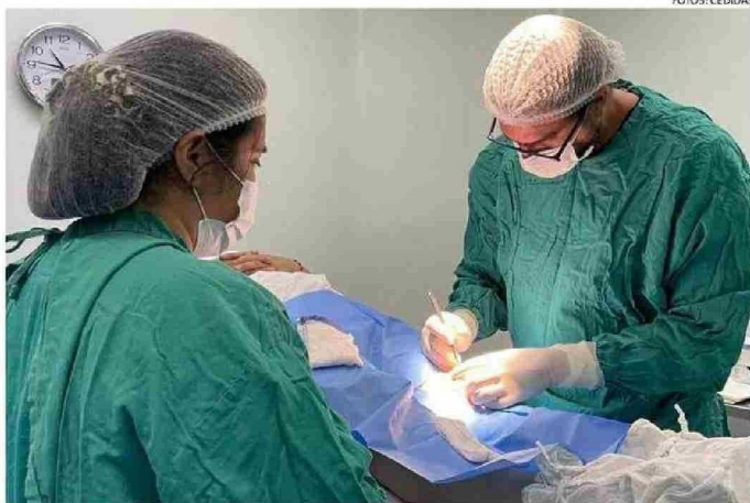
EL OPERATIVO CONSIDERA INTERVENCIONES QUIRÚRGICAS.

son los profesionales que están participando de esta iniciativa en la provincia.