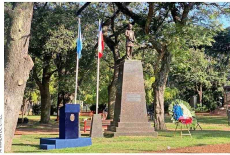
ARMADA DE CHILE

Prat está presente en algunas escuelas navales, como en Brasil, Colombia, Ecuador, México, Perú y Estados Unidos. En esta última se encuentra una figura que fue