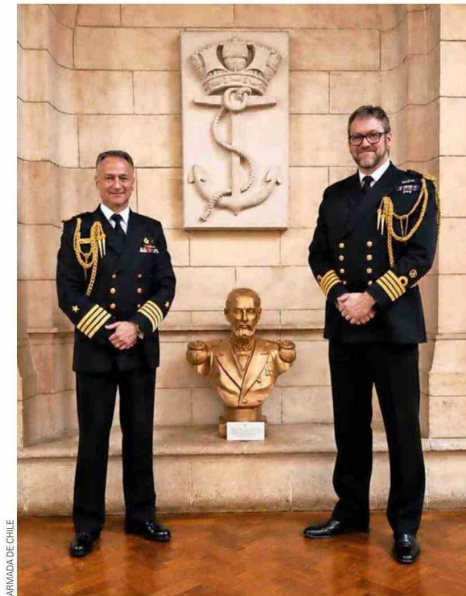
El más reciente busto de Prat se inauguró en Londres, Inglaterra.

Países de América Latina han rescatado su recuerdo, destacando la estatua del héroe ubicada en la plaza República de Chile en Buenos Aires. En Ecuador existe un monumento a Prat en la plaza Chile de Guayaquil y en el Malecón 2000. En Montevideo, Uruguay, existe una calle con su nombre; a metros de ella se emplaza un torso, instalado por la Armada de Chile el 9 de febrero de 1979. En Ciudad de Panamá, se