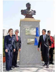
En El Salvador también existe un busto de Arturo Prat.

También se honra a Prat en España. Un monumento del marino chileno se encuentra en Cádiz, en la Alameda Hermanas Carvia Bernal junto a otros próceres iberoamericanos; uno en Santa Coloma de Farnés,